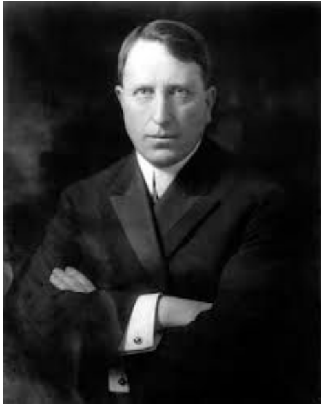
William Randolph Hearst